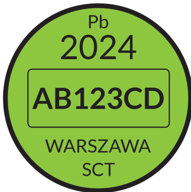
Rysunek 1. Wzór nalepki dla pojazdów uprawnionych do wjazdu do strefy czystego transportu