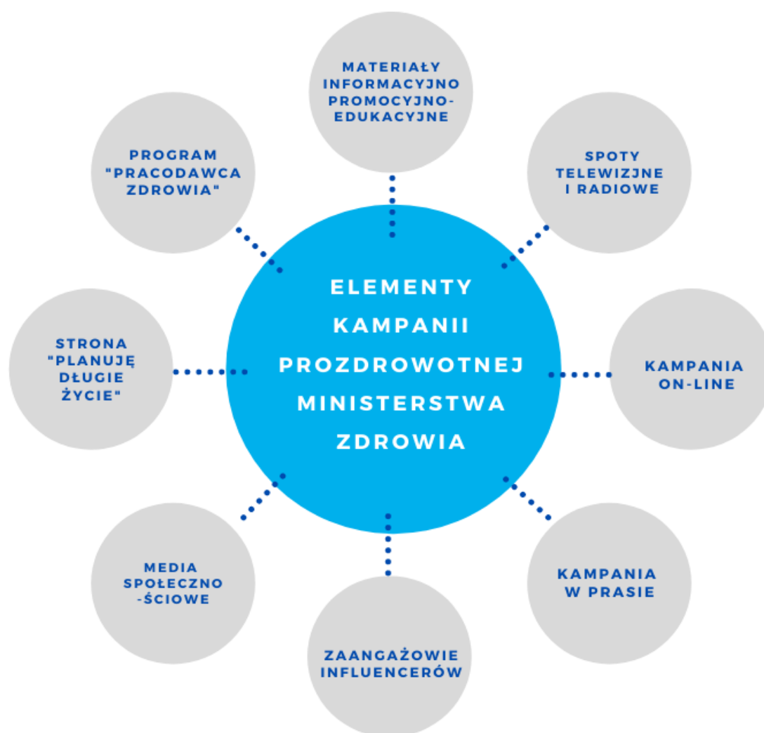
Rysunek 2. Elementy kampanii prozdrowotnej Ministerstwa Zdrowia.

Wszystkie działania realizowano w ścisłej współpracy z ekspertami NIO-PIB oraz z ekspertami z regionów, którzy aktywnie uczestniczyli w programach telewizyjnych i audycjach radiowych, a także w przygotowywaniu treści do artykułów prasowych oraz na stronę internetową kampanii. W ramach realizacji zadania przeprowadzono szereg działań służących podniesieniu świadomości społecznej w zakresie postaw prozdrowotnych, których zakres przedstawia Rysunek 2.