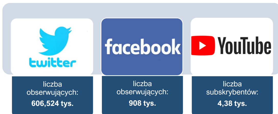
Rysunek 3. Liczba obserwujących w mediach społecznościowych oraz liczba subskrybujących w mediach internetowych (dane statystyczne – stan na dzień 31 grudnia 2021 r.)